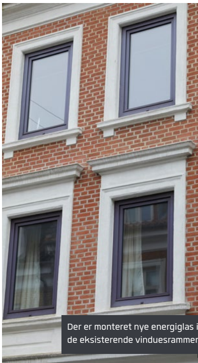
Der er monteret nye energiglas i de eksisterende vinduesrammer.