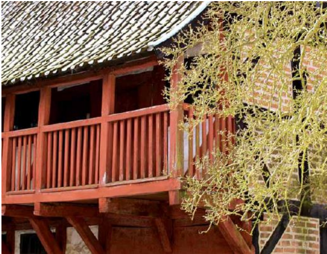
Svalegangen har sin moderne slægtning i altangangen (Den gamle by, Århus).

Det kan man bl.a. se på et antal huse i Den Gamle By i Århus og i de bevarede gamle købstadsmiljøer rundt om i Danmark. Med væksten i de europæiske storbyer opstod behovet og muligheden for at lave altaner på de store etageejendomme. Foran de store opholdsrum ses gerne en altan, der i dagligdagen nok mere var et arkitektonisk end et anvendeligt element. Opholdsaltanen er et nyere fænomen, som vi skal se nedenfor.