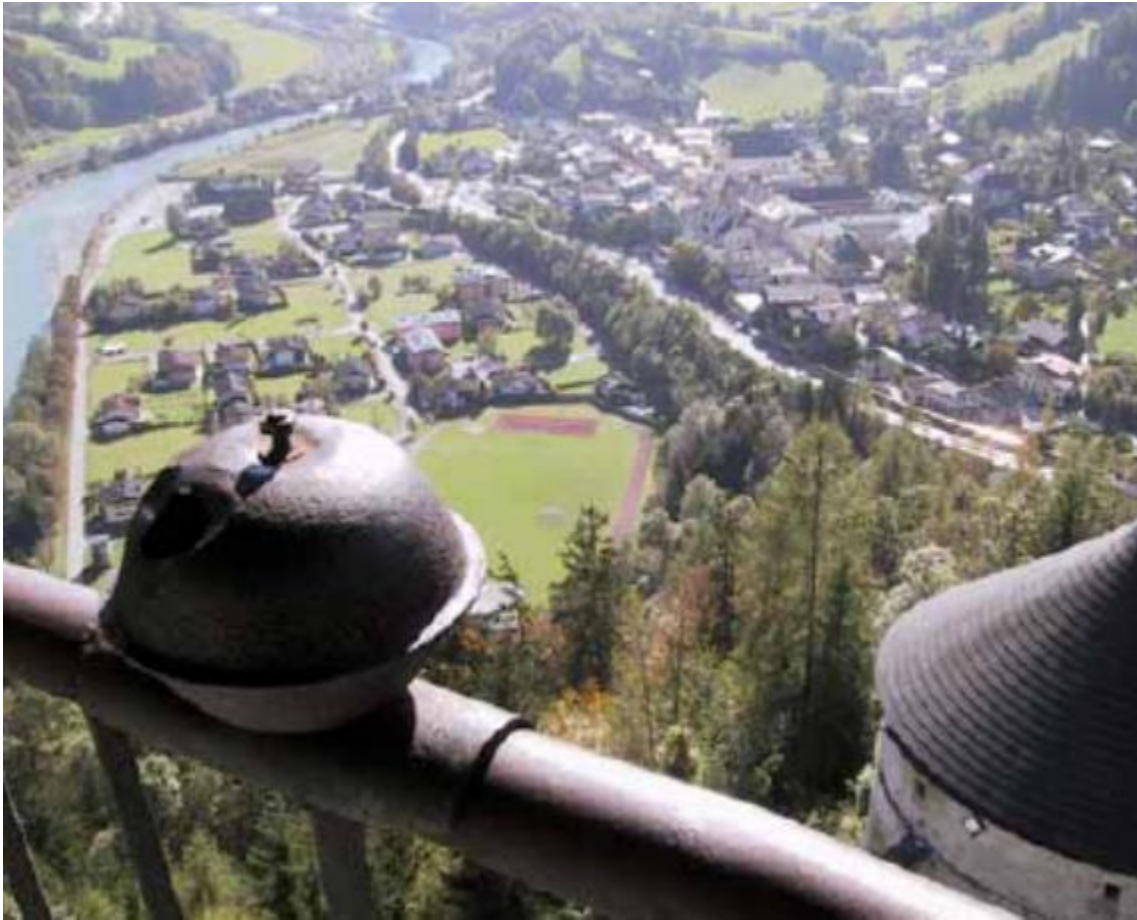
Fra en skyttealtan på middelalderborgen Hohenwerfen i Salzburgerland, Østrig - med fantastisk overblik og udsigt