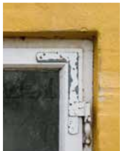
Et ældre beslag trænger til ny maling